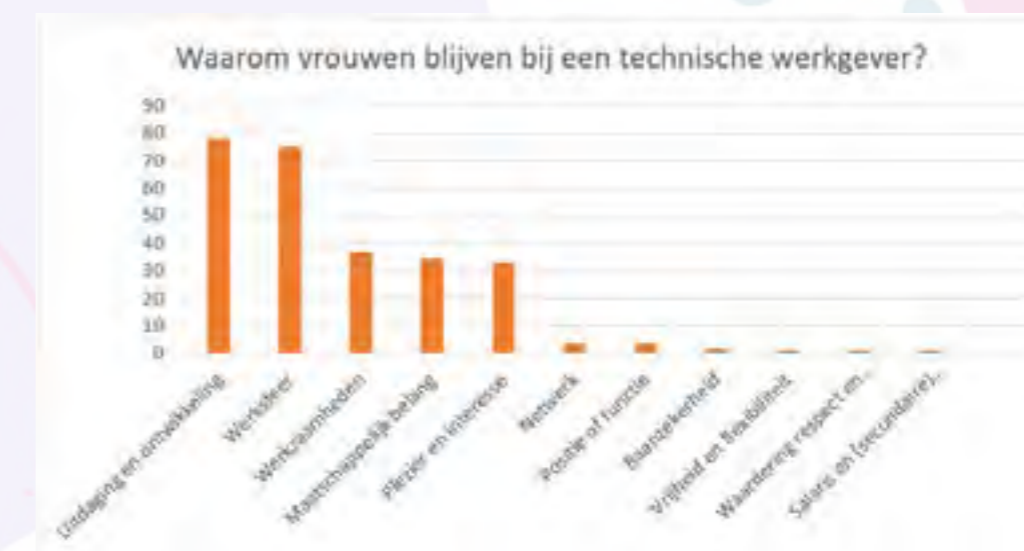
Figuur 3: Onderzoek onder 189 vrouwelijke professionals in bèta, techniek en IT, 2022 – Redenen om bij een technische werkgever te blijven