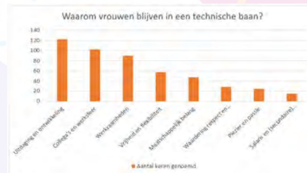
Figuur 2: Onderzoek onder 189 vrouwelijke professionals in bèta, techniek en IT, 2022 – Redenen om in een technische baan te blijven

Ze komen gender bias tegen, ze voelen ze niet veilig genoeg, kunnen werk en privé niet goed combineren of de cultuur is niet prettig. Dat zijn oorzaken waar je als werkgever iets aan kunt doen. In het volgende hoofdstuk zullen we uitleggen welke acties je als werkgever kunt nemen.